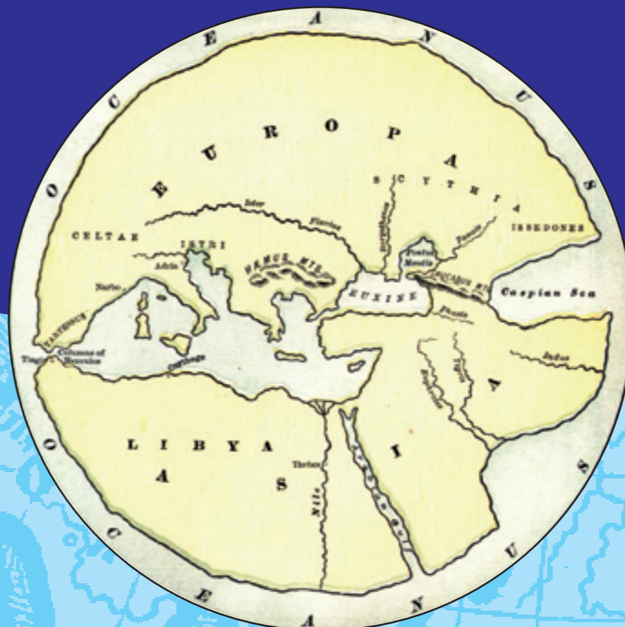
Le monde selon Hécate - Vers 520 avant notre ère

La carte est utile et pratique, mais elle peut être aussi belle, impressionnante, dangereuse, fausse, fantastique, irréaliste, artistique... et faire jouer nos sens et notre vision du monde.